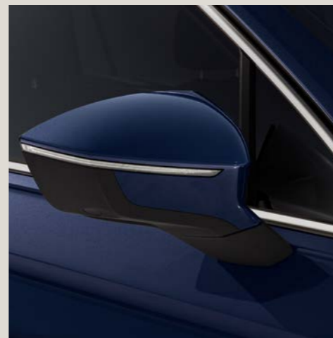
Blu Atlantico** St Bu XE