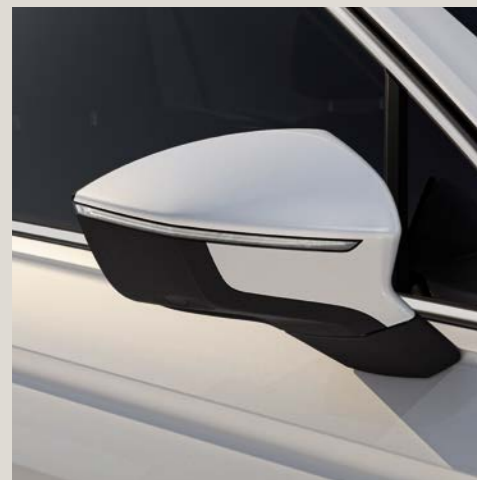
Bianco Orice*** St Bu XE