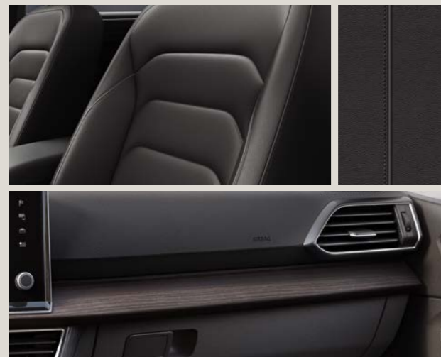
Pelle Vienna nero - LM + PL1