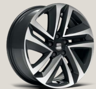
Performance 18" Machined