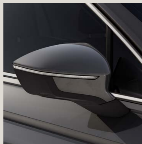
Grigio Urano* St Bu XE