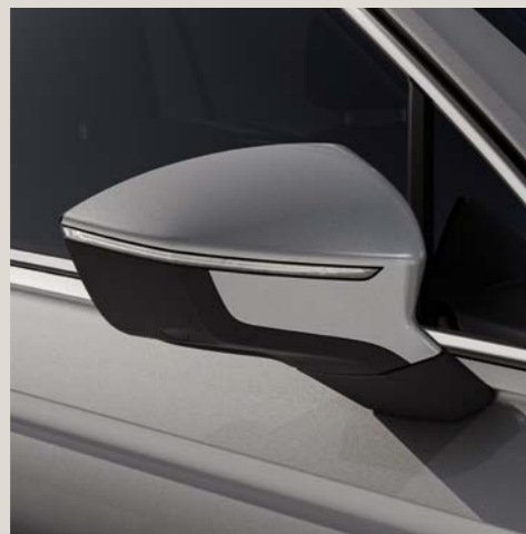
Argento Reflex** St Bu XE