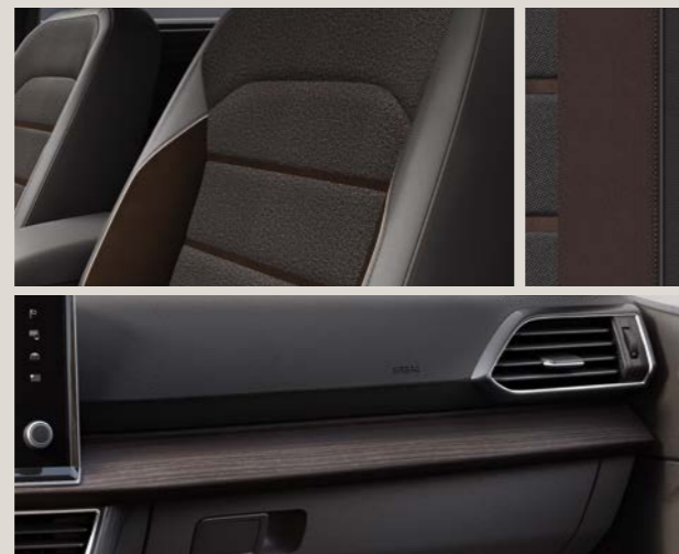
Rivestimento in tessuto Baza / Alcantara® / PVC Bison - LM