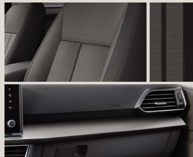
Tessuto Olot con inserti in Alcantara® nera - FG