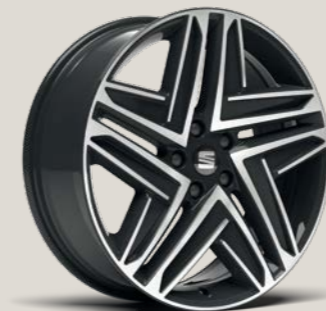
Exclusive 19" Machined