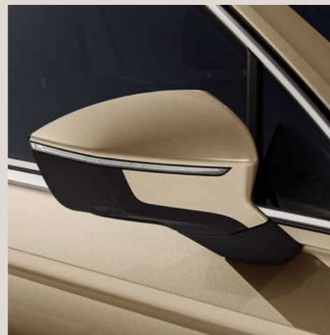
Beige Titanio** St Bu XE