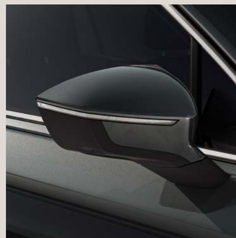
Verde Camouflage*** St Bu XE