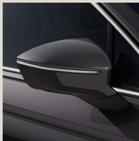
Grigio Iridio** St Bu XE