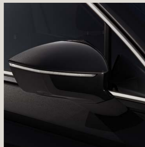
Nero Assoluto** St Bu XE

Style St Business Bu Xcellence XE Di serie ■ Disponibile a richiesta ■ *Pastello. **Metallizzato. ***Esclusivo.