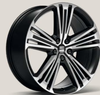
Supreme 20" Machined